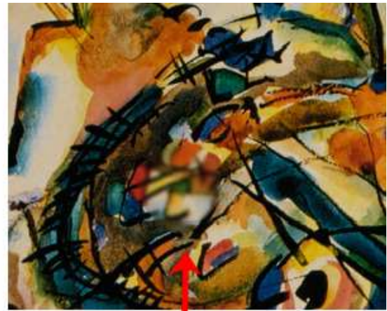
Abbildung 1. Darstellung des Reizmaterials ohne Zielreiz (links) und mit Zielreiz (rechts). Ausschnitt der Instruktion für die Testpersonen aus Fuchs, Ansorge, Redies und Leder (2011).

Die Salienz der Regionen innerhalb eines Bildes wurden im Zuge einer Voruntersuchung ermittelt. Die Salienzkarten der Bilder, anhand welcher die Salienz der Bildregionen ersichtlich ist, wurden mittels der „saliency-toolbox“ von Walther und Koch (2006) errechnet. Die salienteste Stelle in einem Bild nach Analyse der Voruntersuchung wurde als hoch saliente Zielposition verwendet. Im selben Bild wurde die salienteste Stelle eines anderen zufällig gewählten Bildes herangezogen, um als niedrig salienter Ort zu fungieren. Die geringste Distanz des niedrig salienten Ortes zu den fünf salientesten Orten betrug bei jedem Bild vier Grad des Blickwinkels. Die fünf salientesten Orte wurden für jedes veränderte Bild erneut bestimmt.