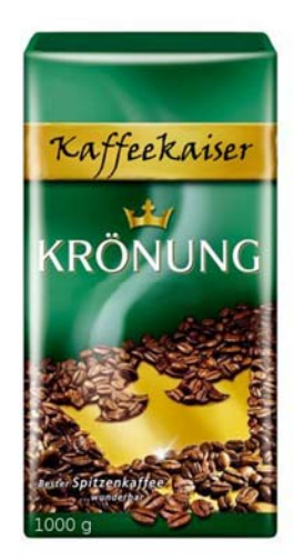
Fig. 1. Coffee without additional cue and in low and high quantity