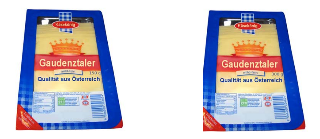
Fig. 7. Cheese without additional cue in low and high quantity.