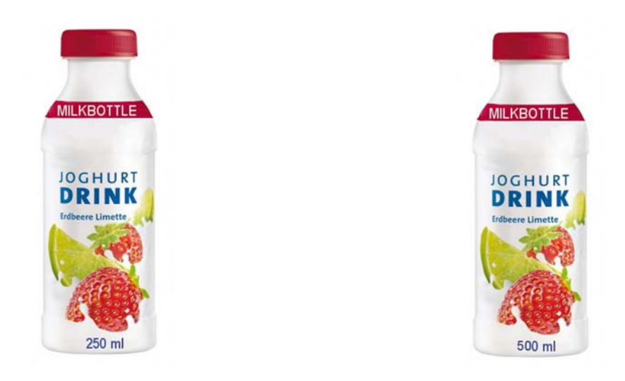
Fig. 13. Yoghurt drink without additional cue in low and high quantity.