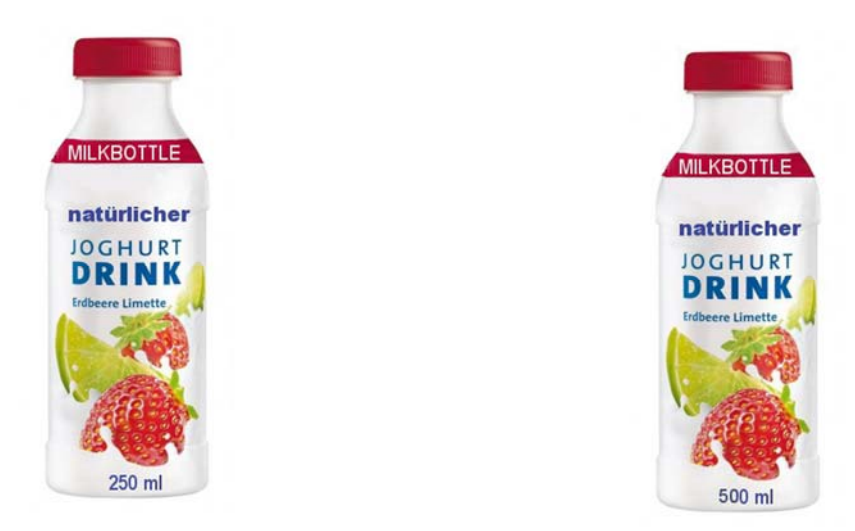
Fig. 14. Yoghurt drink with additional cue in low and high quantity.