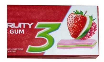
Fig. 9. Chewing gum without additional cue in low and high quantity.