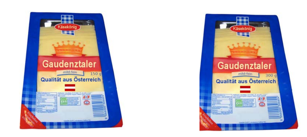
Fig. 8. Cheese with additional cue in low and high quantity.

Fig. 7. Cheese without additional cue in low and high quantity.