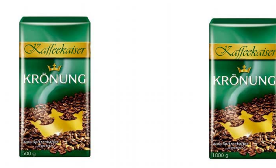
Fig. 2. Coffee with additional cue in low and high quantity.

Fig. 1. Coffee without additional cue and in low and high quantity