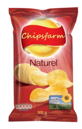
Fig. 4. Chips with additional cue in low and high quantity.