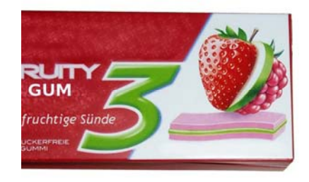
Fig. 10. Chewing gum with additional cue in low and high quantity.