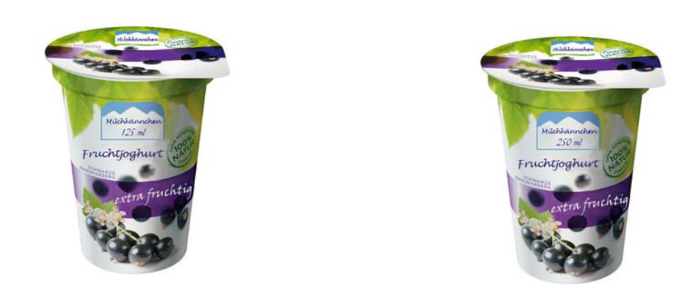
Fig. 16. Yoghurt with additional cue in low and high quantity.