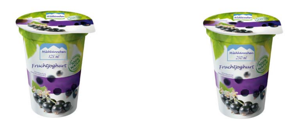
Fig. 15. Yoghurt without additional cue in low and high quantity.