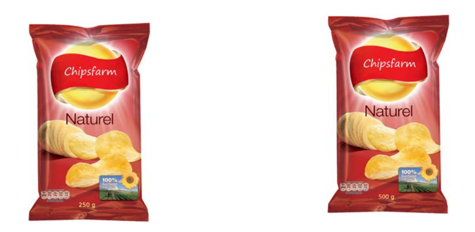
Fig. 3. Chips without additional cue in low and high quantity.