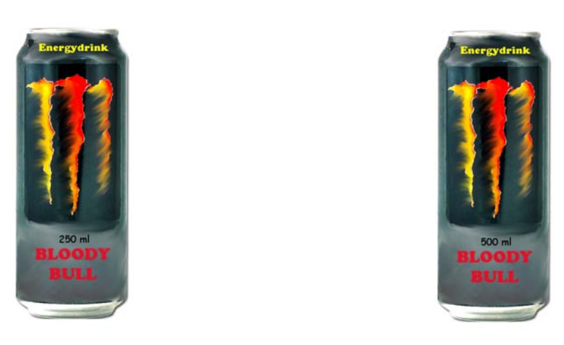
Fig. 11. Energy drink without additional cue in low and high quantity.