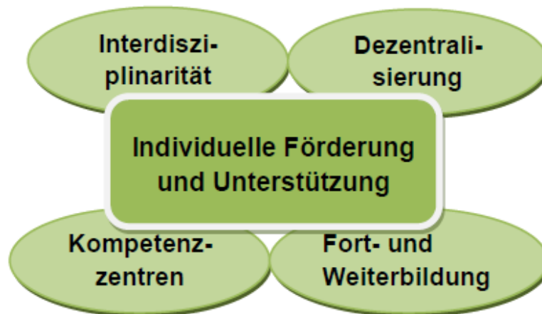
Abbildung 3: Individuelle Förderung und Unterstützung im Versorgungssystem bei ASS

Aufgrund der Eingrenzung für diese Masterarbeit wird im Folgenden nur auf einen Teil der Grafik zum Versorgungssystem bei ASS Bezug genommen. Dies betrifft die individuelle Förderung und Unterstützung mit den diversen Unterpunkten: